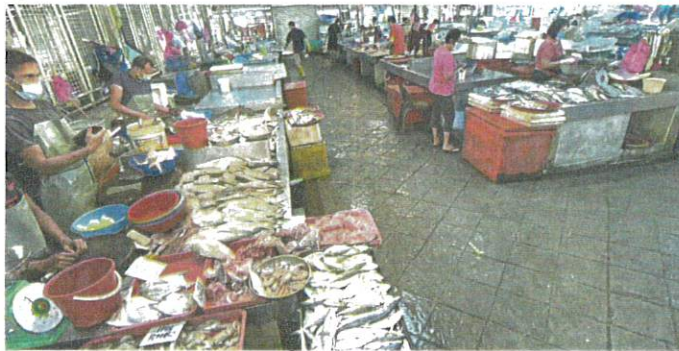
All quiet: Pulau Tikus wet market almost devoid of customers due to fear of the pandemic.

Her six-year-old daughter was "required"